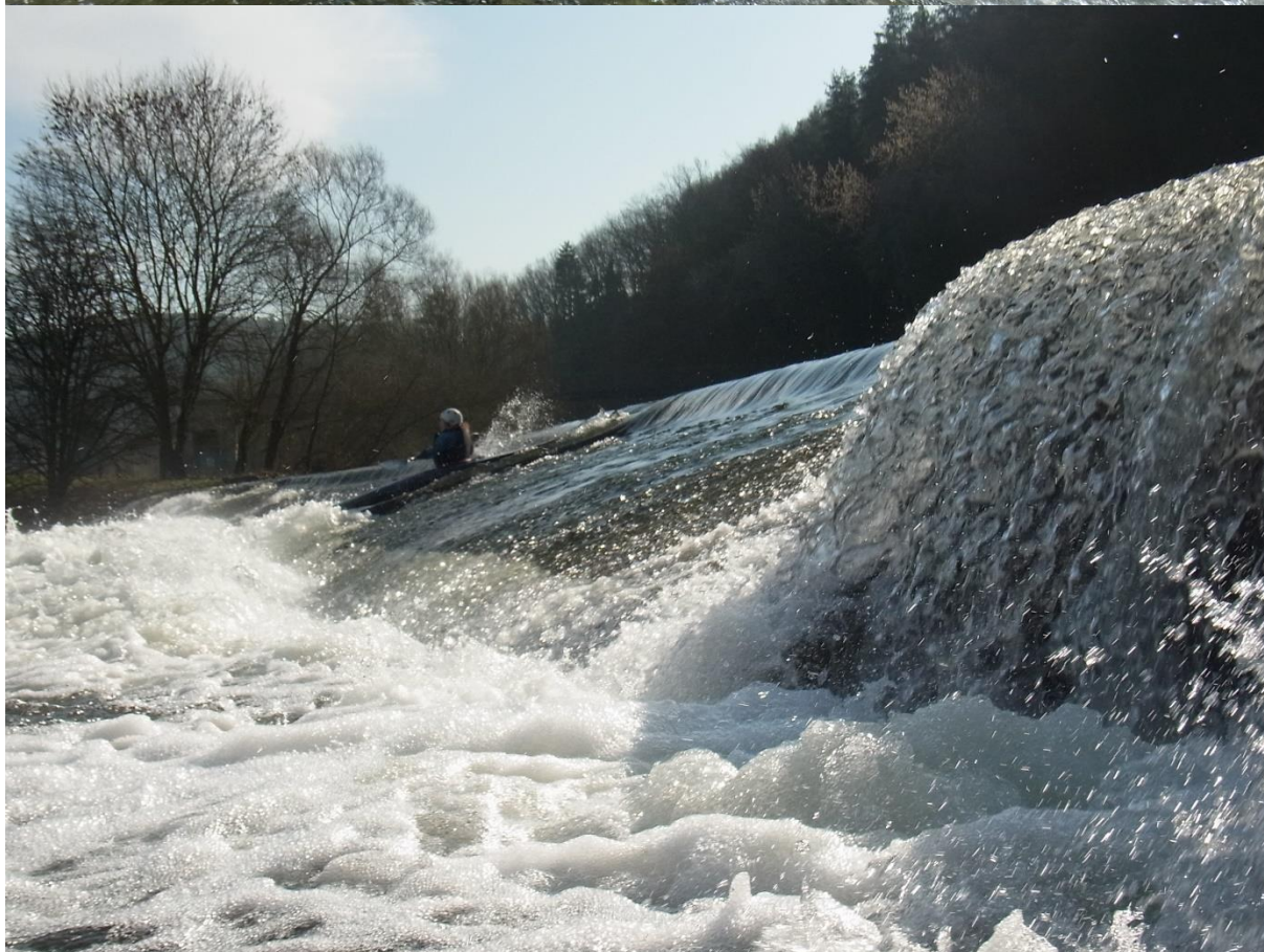
Bilder: Torsten Klakow, März 2024