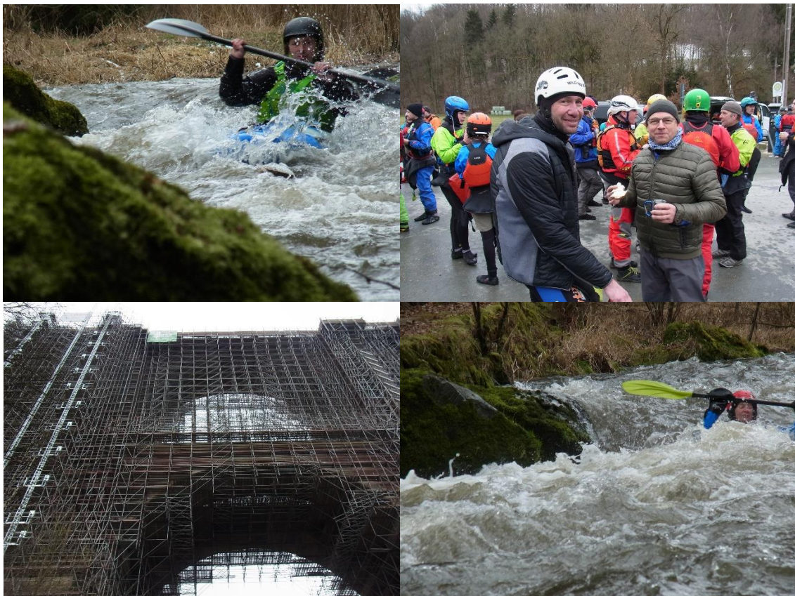
Bilder aus 2023 (Torsten Klakow)

Torsten Klakow für den TSV 1880 Gera-Zwötzen e.V., Abt. Kanu